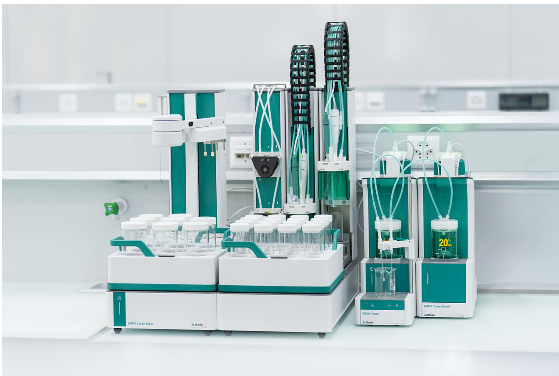
Abbildung 1 OMNIS Probenroboter S ausgestattet mit OMNIS Titrator, Dosiermodul und dUnitrode Elektrode zur automatisierten Bestimmung von Pyrophosphat in wässrigen Proben.

Die Bestimmung erfolgt mit einem OMNIS Titrator ausgestattet mit einer dUnitrode an einem OMNIS Sample Robot S (Abbildung 1).