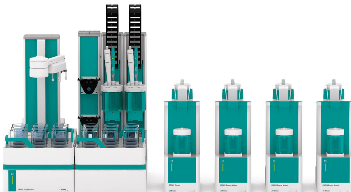
Abbildung 1. OMNIS Sample Robot S mit einem OMNIS Titrator und drei OMNIS Dosiermodulen. Nicht abgebildet: zusätzlicher OMNIS-Probenroboter mit Titrator- und Dosiermodulen sowie erforderlicher Dosierschnittstelle und Dosinos.