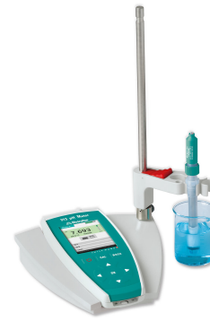
Figure 1. 913 pH-Meter, ausgestattet mit einer pH-Elektrode. Beispielaufbau zur Bestimmung des pHe-Wertes.

Eine definierte Probenmenge wird in ein 100-mL-Becherglas gegossen und auf eine externe Rührplatte gestellt. Die EtOH-Trode und der Temperatursensor werden eingetaucht und die Messung wird sofort gestartet. Der Wert nach 30 Sekunden gilt als Säurestärke der Probe.