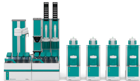
Abbildung 1. Der OMNIS Sample Robot S ist ausgestattet mit einem OMNIS Professional Titrator, einer entsprechenden Anzahl von OMNIS Dosiermodulen zur Zugabe aller notwendigen Lösungen und einer dPt-Titrode zur automatischen Bestimmung der Iodzahl.

Eine Probenvorbereitung ist nicht erforderlich.