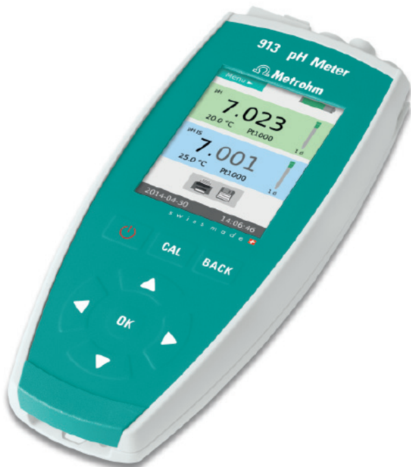
913 pH Meter – zwei pH-Werte gleichzeitig messen

Ob draussen im Feld oder im Prozess: Messpunkte abgehen, Ergebnisse mit einem Tastendruck speichern, gesammelte Daten am PC im Büro oder Labor auslesen und ins LIMS exportieren oder bequem in tiBase speichern und verwalten.