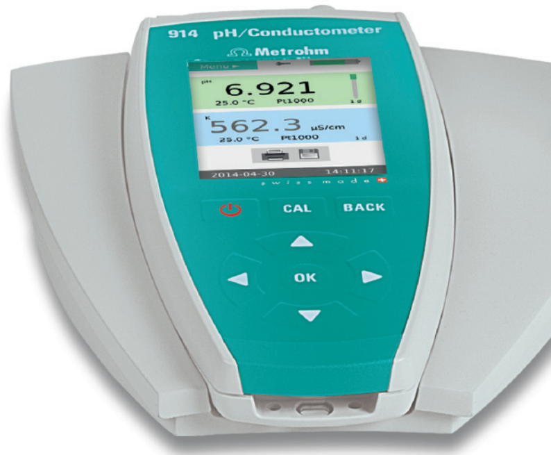
914 pH/Conductometer – pH-Wert und Leitfähigkeit gleichzeitig messen