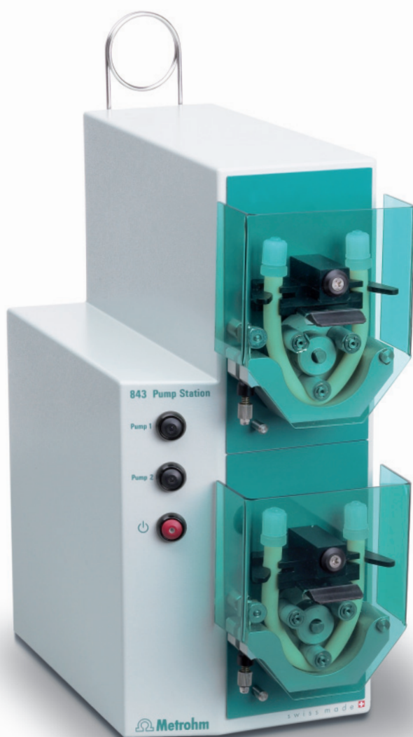
843 Pump Station (peristáltica)