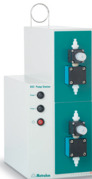
843 Pump Station (membrana)