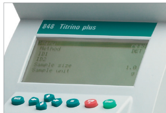
Alles im Blick – das grosse Display des 848 Titrino plus.