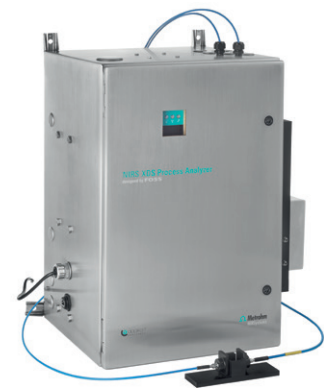
NIRS XDS Process Analyzer