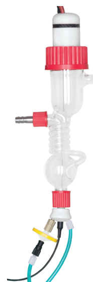
Dampfstrahl-Aerosolsammler (SJAC) des 2060 MARGA.