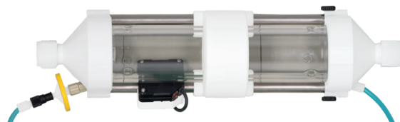
Rotierender Diffusionsabscheider (WRD) des 2060 MARGA.

Die Umgebungsluft aus dem WRD, die nun frei von wasserlöslichen Gasanteilen ist, wird in den SJAC überführt. Übersättigter Wasserdampf wird zugeführt wodurch die Aerosole zu größeren, schwereren Tropfen heranwachsen. Im weiteren Verlauf durchströmt die Luft einen Zyklon, der die Partikel infolge Trägheitsabscheidung trennt. Die gelösten Aerosolspezies werden kontinuierlich am Boden des SJAC gesammelt und zusammen mit der Probe aus dem WRD zum Ionenchromatographen geleitet.