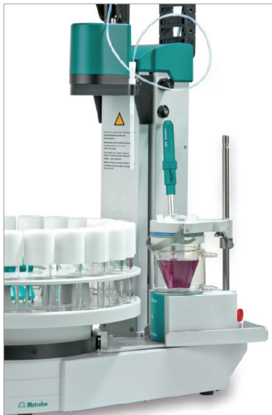
Detailansicht der externen Titrierzelle im MATi 13

* Der Thermostat zum Beheizen der externen Titrierzelle muss separat bestellt werden.